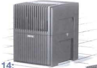
LW 14: Befeuchtungsleistung bis 17 m 2 Reinigungsleistung bis 10 m 2

Mit einem Handgriff werden Elektrik und Ventilator für einfache Säuberung aus dem Gehäuse gehoben. Doppelwandige Bauweise ohne Ecken und Kanten mit integriertem Lauflager für Plattenstapel.