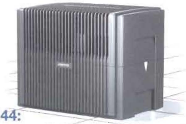
LW 44: Befeuchtungsleistung bis 68 m 2 Reinigungsleistung bis 40 m 2 Ein beheizter 30-m 2 -Raum benötigt pro Tag ca. 5 Liter Wasser.