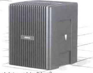
LW 24: Befeuchtungsleistung bis 34 m 2 Reinigungsleistung bis 20 m 2